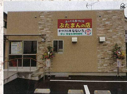
10月21日 工房ないろオープン