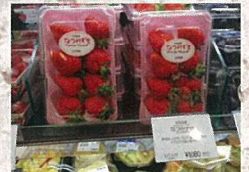
7月29日 夏イチゴ(三越)