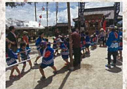
7月15日 目達原祇園祭