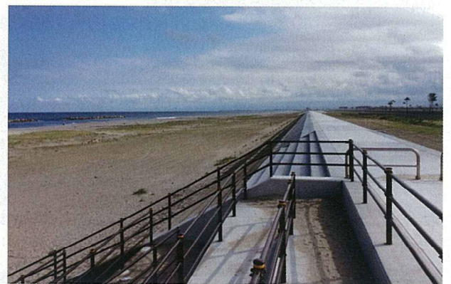
平成28年7月20日 仙台市荒浜地区