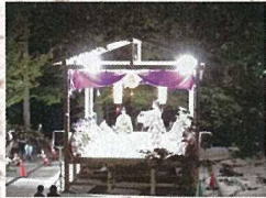
4月14日 仁比山神社御田祭