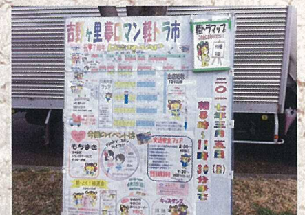
3月5日 軽トラ市7周年