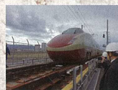
1月27日 フリーゲージ特レイン