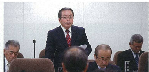
平成28年11月10日 決算特別委員会