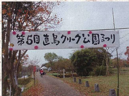
11月20日 クリーク公園まつり