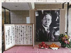
11月23日 吉田絃二郎生誕祭