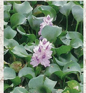
10月25日 ホテイアオイ