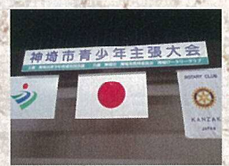
1月28日 神埼市青少年主張大会