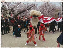
H28年4月3日 みゆき大祭