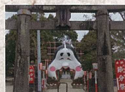
2月4日 節分祭(榎田宮)