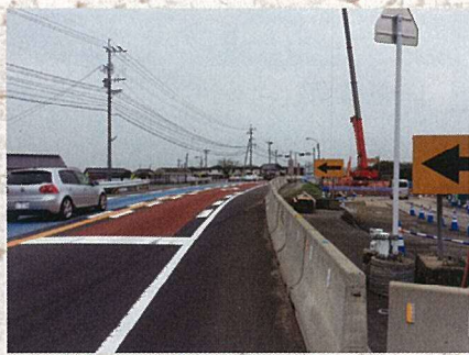
4月8日 国道34号(姉川橋)