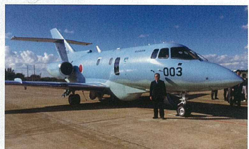
平成28年10月13日 秋田空港