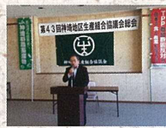
5月12日 生産組合総会