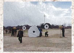
1月22日 横武百手祭り