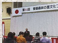
11月30日 脊振町文化祭