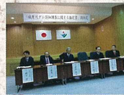
1月20日 城原川ダム調印式