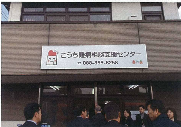
平成29年1月19日 高知県難病相談センター