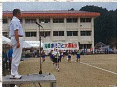
9月3日 脊振まるごと運動会