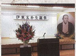
2月18日 伊東玄朴生誕祭