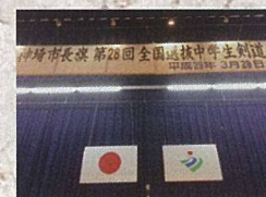
3月29日 全国中学生剣道大会